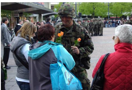
Rosen verteilen – ein Novum.

Der Bataillonskommandant ist nach dem WK überzeugt: «Die Milizarmee ist bereit, wenn man sie im Ernstfall braucht und wenn sie rechtzeitig mit der nötigen Ausrüstung in der richtigen Menge ausgerüstet wird.» Auf die Rede des Kommandanten folgt ein ungewöhnlicher Akt: 65 Rosen werden an die weiblichen Gäste verteilt. Nach dem Fahnenmarsch und dem Abmarschieren der Truppen löst sich die Szenerie um den Marktplatz bald wieder auf und der Alltag nimmt seinen Trott auf. Sowohl für die Zürcher Bevölkerung, wie für das Inf Bat 65, war's ein spezielles Erlebnis. MHA