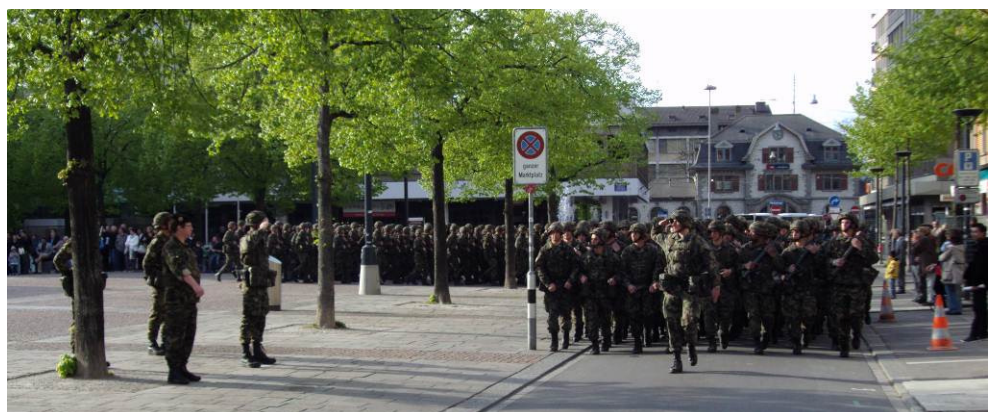
Der Vorbeimarsch am Ende der Fahnenzeremonie.