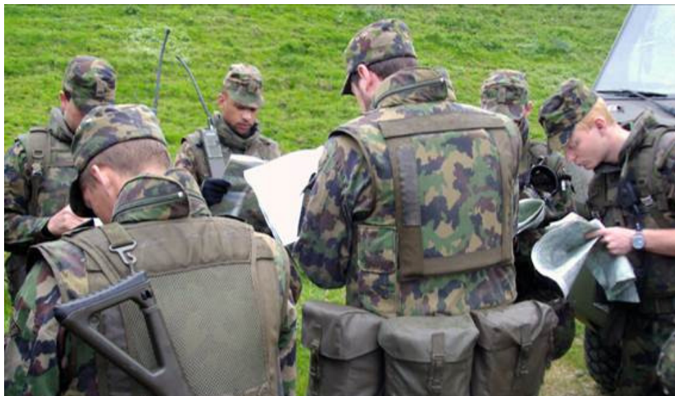
Orientierung auf den Karten über den Einsatzraum.