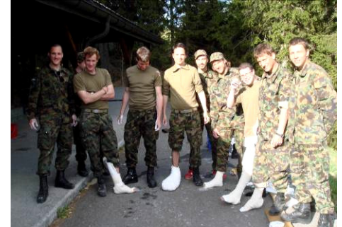
«Die Ärzte» und ihre «Patienten».

Fixationen sind für die Erstellung der Transportfähigkeit sehr wichtig. Das Anlegen eines Gipses stellt sicher, dass ein gebrochener Knochen nicht mehr bewegt werden kann. Dies wurde ausgiebig geübt. Nachdem die supponierten Wunden abgedeckt und die möglichen Druckstellen im Bereich der Gelenke mittels Watte gepolstert waren, passten die «Gipser» die Schiene an.