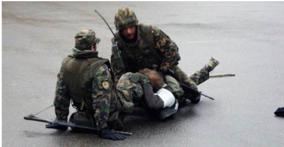
Festnahme eines Demonstranten.

Vorerst gilt es, Fahrzeuge zu kontrollieren. Tatsächlich meldet der Posten nach kurzer Zeit die Verhaftung von zwei Verdächtigen, die ein Funkgerät