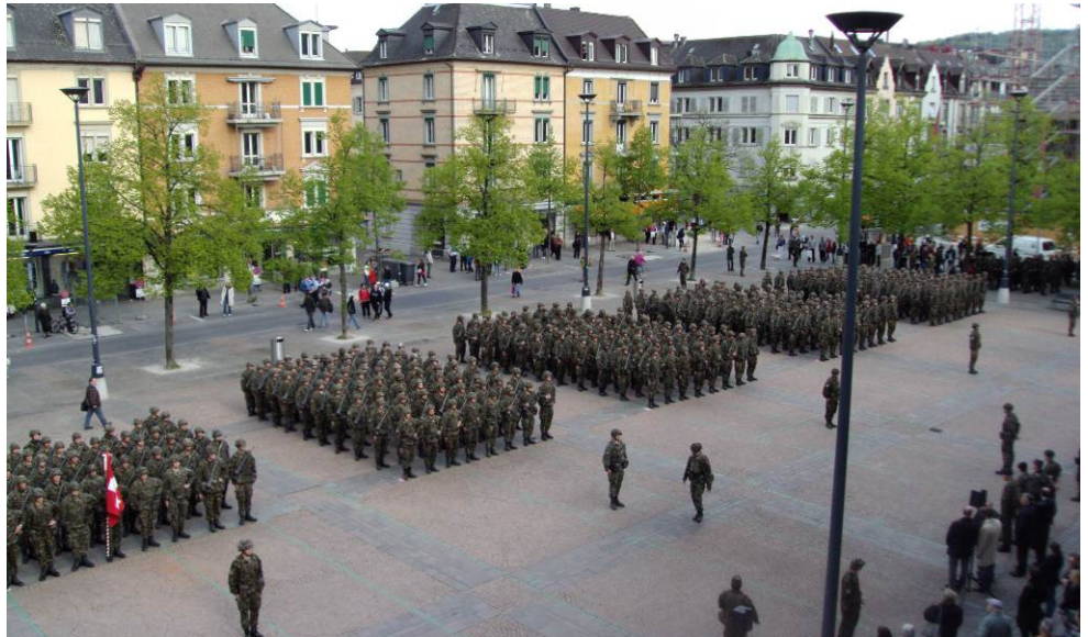
Das Inf Bat 65 in Formation auf dem Marktplatz in Zürich Oerlikon.